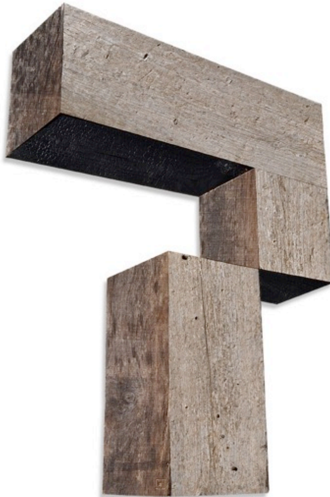
3 2 1 Cube ?, bois brut et brulé, 130x86 cm

Illusions d'optique, les sculptures en bois d' Antonius Driessens sont le produit du vieillissement, de la brûlure, de l'érosion et de la construction de panneaux géométriques. Ses œuvres cherchent toujours l'expérience de la temporalité et de l'espacement du voir. Elles exigent un spectateur actif, qui, initialement désorienté, prenne le temps de faire des allers retours devant l'œuvre, afin de comprendre sa complexité dans l'espace où elle se trouve.