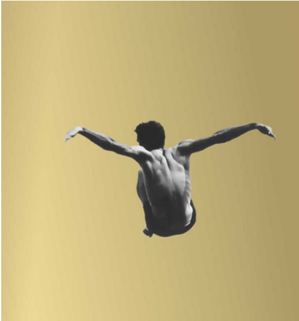
L'Allégresse de la Fureur , huile sur inox or miroir, 100x100 cm

La perfection de l'homme est la recherche permanente de ce monde. Ce que nous projetons dans le miroir doit être ce que voit l'autre, celui-ci fondamental dans le comportement social.