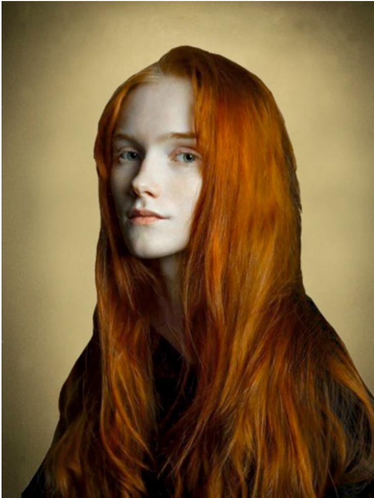
Olivier Diaz de Zarate, Dans le silence de moi même , huile sur inox or miroir, 94x70 cm