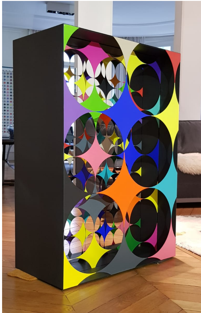
Encoche, Série Elusive Circles, Métal coupé et peint, 160x70x40 cm

L'œuvre d' Arièle Rozowy est une vibrante expérience d'effets visuels : dimensionnels et colorimétriques. Reflétant et redéfinissant les techniques de l'op-art et de l'orphisme, l'artiste situe son univers entre la sculpture et l'architecture.